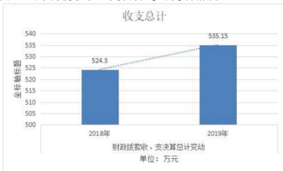
图4：财政拨款收、支决算总计变动情况

2019年度财政拨款收入总计535.15万元、支出总计535.15万元。与2018年相比，财政拨款收、支总计各增加10.85万元，增长2%。主要原因是农林水支出增加。