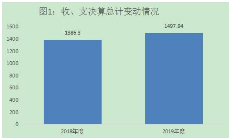
图 1：收、支决算总计变动情况（单位：万元）

2019 年度收、支总计 1497.94 万元。与 2018 年相比，收、支总计各增加 116.64 万元，增长 8.05%，主要原因是税收收入完成情况较好，人员增资提标，全面加大特色重点项目投资建设。