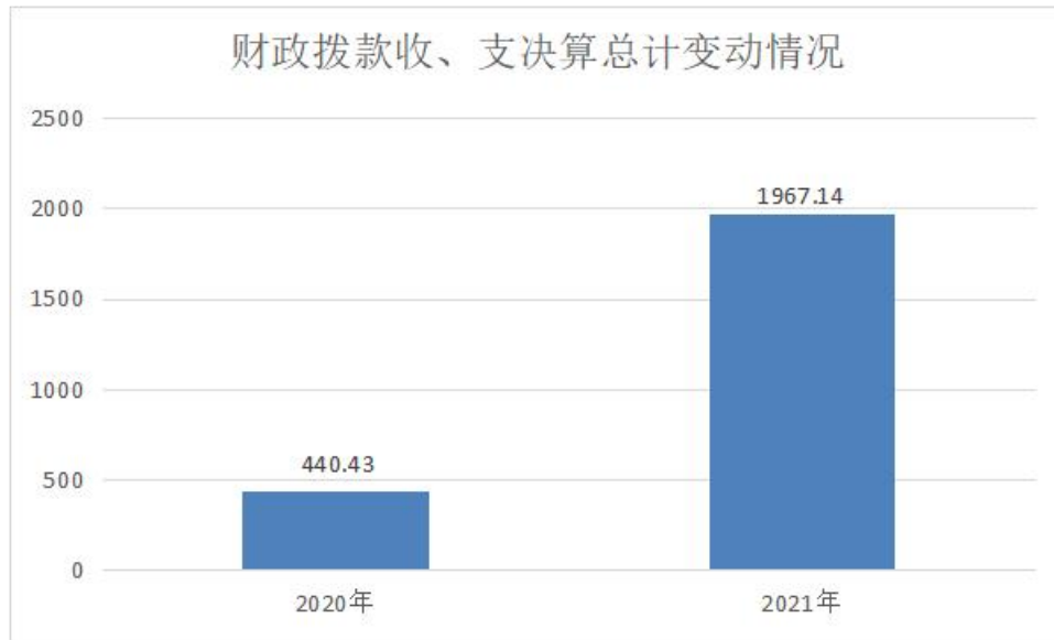
图 4：财政拨款收、支决算总计变动情况 单位：万元

因是 2021 年年初街道机构改革实行一办三中心管理，将各站、办、所的人员经费及大部分公用经费都纳入到机关统一核算，相比 2020 年度收支费用大幅度增加。