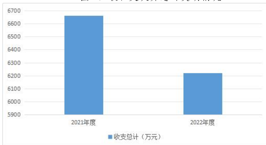
图1：收、支决算总计变动情况

2022年度收、支总计6220.03万元。与2021年度相比，收、支总计各减少440.99万元，下降6.6%，主要原因是在职人员减少。