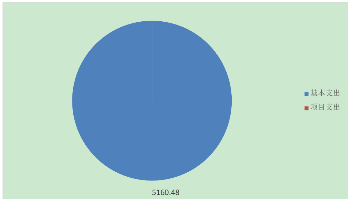
图 3：支出决算结构（万元）

本支出 5160.48 万元，占本年支出 100%；项目支出 0 万元，占本年支出 0%；上缴上级支出 0 万元，占本年支出 0%；经营支出 0 万元，占本年支出 0%；对附属单位补助支出 0 万元，占本年支出 0%。