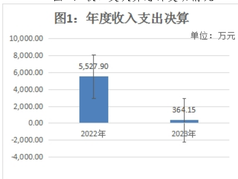
图 1: 收、支决算总计变动情况

2023 年度收、支总计均为 364.15 万元。与 2022 年度相比，收、支总计各减少 5163.72 万元，下降 93.41%，主要原因是本年度学校进行独立核算。